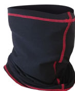
Bufanda Ref. SIRAC