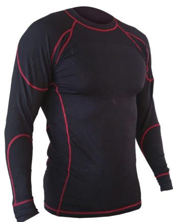
Camiseta mangas largas Ref. SAHO