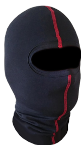
Capucha Ref. SAGA